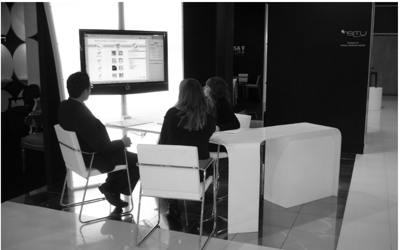
Fig. 2 Expositor y pantalla de visualización