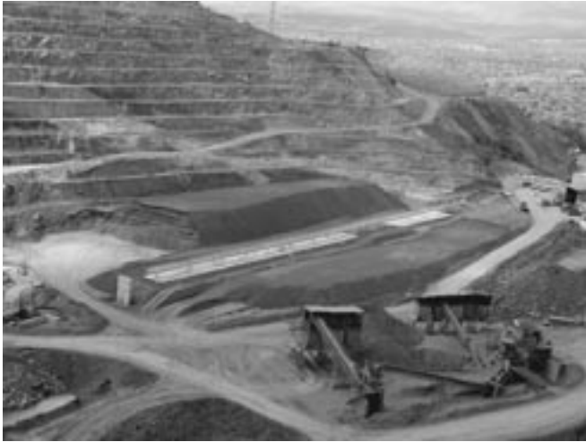
Fig. 1- Imagen que muestra las pilas de homogenización (centro) en una explotación de arcillas.

rojas junto con otras materias primas clásicas como las arcillas de Villar del Arzobispo (Valencia) o de Galve (Teruel), y con cierta ventaja sobre nuevos yacimientos como los de Morella (Castellón) (9). Desde el punto de vista cerámico la arcilla de Moró se clasifica como una materia prima de bajo contenido en carbonatos (< 5%), utilizada fundamentalmente para la fabricación de gres esmaltado de pasta roja por prensado (3). Entre las características más importantes, comparada con otras materias primas para formulaciones de pasta roja, destacan su relativa alta compacidad y baja plasticidad (10). Geológicamente se trata de lutitas compactas de color rojo y edad Pérmico superior (11).