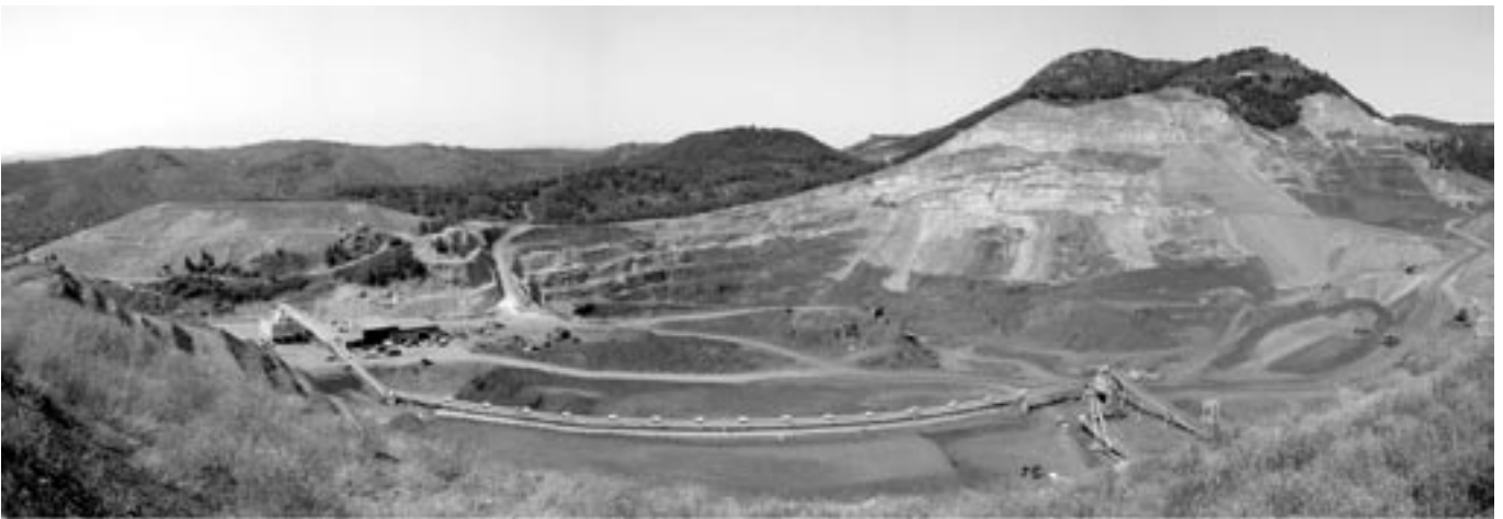
Fig. 2- Aspecto de la explotación de arcilla de Moró de WBB España en Sant Joan de Moró (Castellón).

Aunque las explotaciones de arcilla de Moró se concentran entre los municipios de Sant Joan de Moró y Vilafamés, sus características geológicas, tanto estratigráficas como mineralógicas, pueden hacerse extensivas a toda la zona conocida geológicamente como Desert de les Palmes (6) (Fig. 3). La zona se caracteriza por la presencia de un conjunto de fallas normales de dirección NE-SO, y vergencia principal hasta el NO, que permite el afloramiento del zócalo hercínico, el Pérmico y el Triásico suprayacente, y la cobertera jurásica y cretácica de potencia muy reducida (12). El zócalo hercínico está formado por pizarras y grauwacas de edad Carbonífero